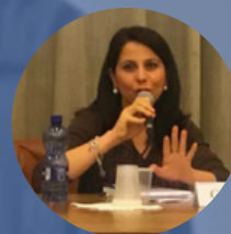
Prof.ssa Grazia Vitale