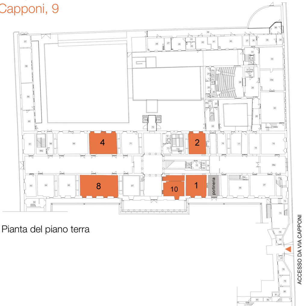
Pianta del piano terra